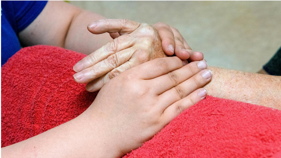
Geschwollene Gelenke verursachen Rheuma-Patienten viele Beeinträchtigungen. Eine Massage kann Linderung bringen

Ein Zimmer in der Klinik für Rheumatologie des Krankenhauses Porz am Rhein: Im Bett liegt eine 76-jährige Patientin und erzählt dem am Fußende stehenden Oberarzt Dennis Scheicht ihre Krankengeschichte. Sie habe niedrig dosiert Cortison eingenommen. Als die Schmerzen durch einen rheumatischen Schub und Rückenbeschwerden stärker wurden, nahm sie zusätzlich hohe Dosen des Schmerzmittels Ibuprofen – mit dramatischen Folgen.